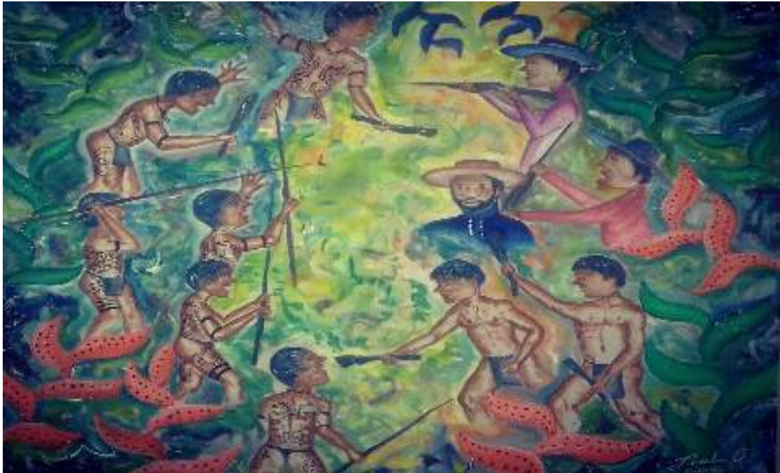
Revelación de los grupos idiomáticos con los patrones: Técnica Ancestral mixta sobre lienzo en llanchama 80 cm x 65 cm. Jacob Quevare-2018

fue a unirse con los enemigos y todos juntos se rebelaron contra todos los patrones de esa época. Entonces cuando llegó el día, los grupos idiomáticos atacaron a los patrones, empezaron a rodear todo el lugar de Santa Catalina” lugar donde reunían todo el producto del caucho, era como las dos de la tarde. Cuando los patrones se vieron acorralados no les quedó otra si no que huir, entonces empezaron a caminar por el “Varadero” de “Santa Catalina” hacia la “Providencia” que está ubicado a orillas del río “Igaraparaná”. Al huir ellos empezaron a caminar día y noche para poder así escaparse de los enemigos, atravesando montañas y trochas, caminaban cruzando el camino uno al otro